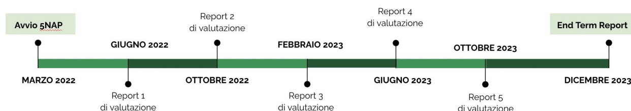
Figura 1. Timeline dei rapporti di valutazione del 5NAP

Nell'arco dell'attuazione del 5NAP, verranno prodotti 5 rapporti di valutazione secondo le tempistiche indicate nella timeline illustrata in Figura 1.